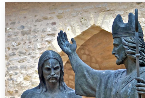
Baptême de Clovis

C'est durant cette cérémonie – événement clef de l'Histoire de France – que l'on attribue à Remi ces célèbres mots, adressés au roi des Francs : « Courbe la tête, fier Sicambre*. Adore ce que tu as brûlé et brûle ce que tu as adoré »